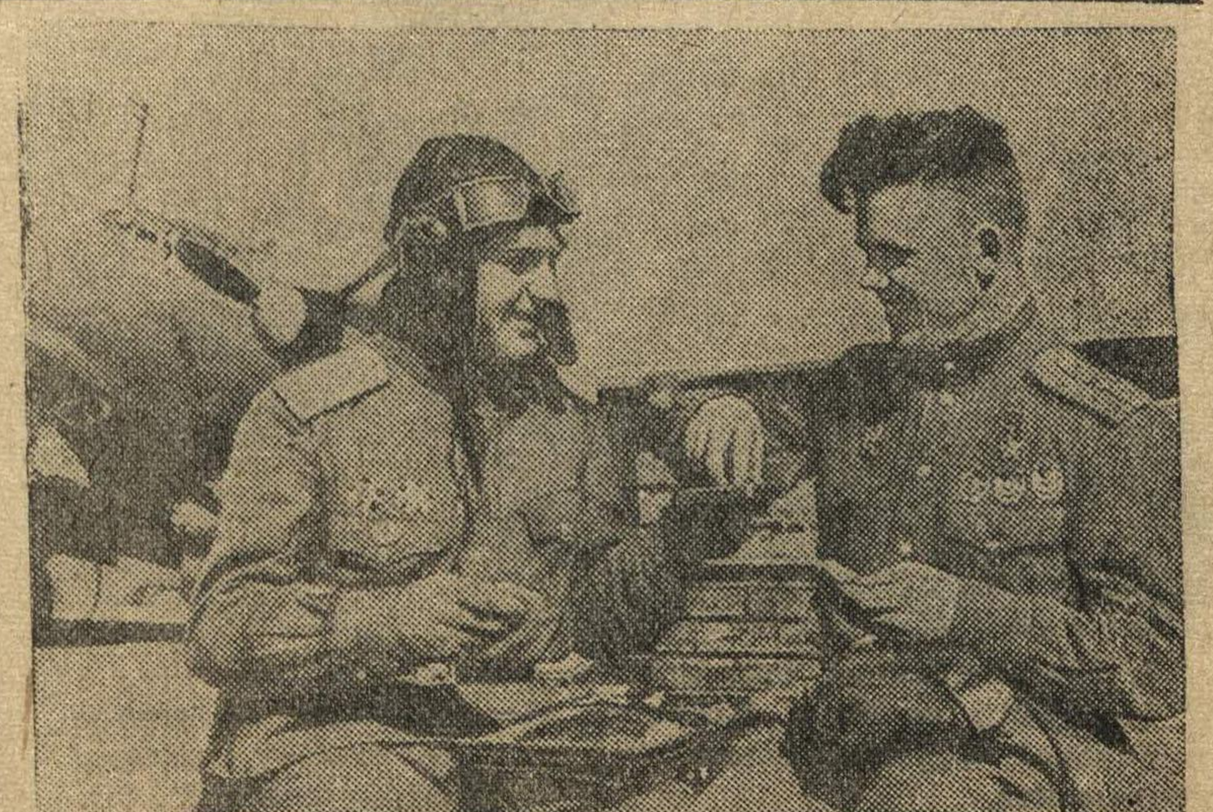
Бесстрашные пикировщики Герой Советского Союза гвардии капитан Н. А. Плотников (справа), совершивший 305 боевых вылетов на бомбардировку вражеских войск, и гвардии капитан К. Ф. Мулюкин, совершивший более 130 вылетов.

Редакция газеты «На страже» обращается к секретарям парторганизаций с просьбой обсудить публикуемые статьи на оперативных совещаниях в ГО и РО НКВД и отделениях милиции города. Одновременно просьба к оперативному составу и всем читателям выступить на страницах газеты по затронутым в статьях вопросам.