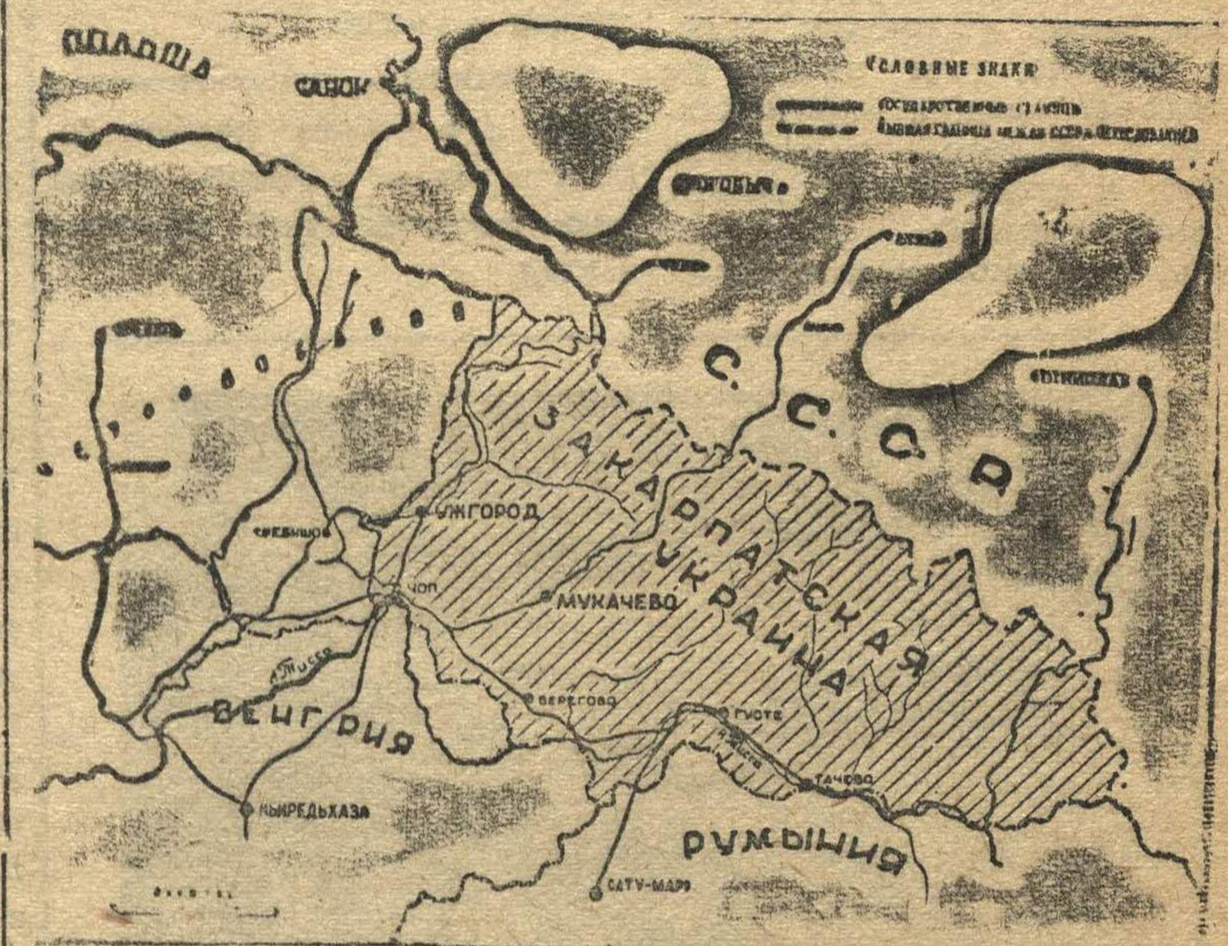
Карта Закарпатской Украины, включенной в состав Украинской Советской Социалистической Республики на основании дружественного соглашения между Союзом Советских Социалистических Республик и Чехословацкой Республикой от 29 июня 1945 года.