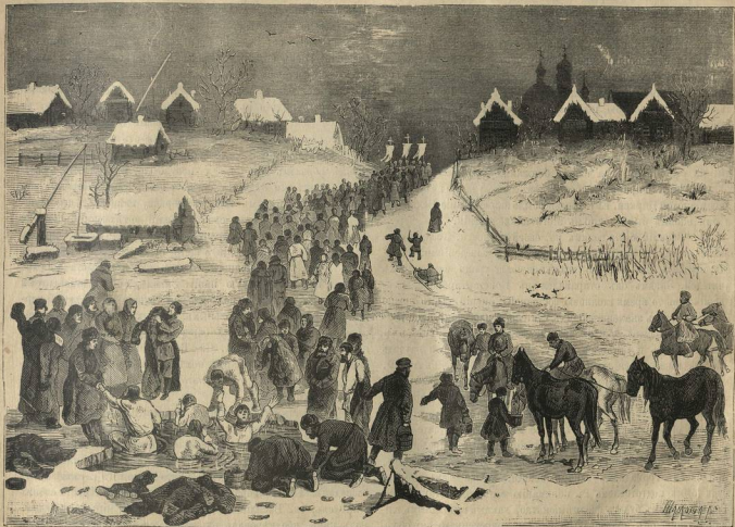
Праздникъ Крещенія въ деревнѣ.

утреннее богослуженіе, а затѣмъ и божественная литургія. Въ Успенскомъ соборѣ богослуженіе совершалъ Стефанъ, архіепископъ Рязанскій, съ многочисленнымъ духовенствомъ. Между тѣмъ находившіяся въ Москвѣ войска выступали строемъ со всѣхъ концовъ Москвы и сѣдѣли въ Кремль съ распушенными знаменами, съ музыкою и барабаннымъ боемъ. Самъ царь, разставивъ войска на Ивановской площади, сѣдѣли въ Успенскій соборъ для слушанія божественной литургіи, по окончаніи которой преосвященный Стефанъ произнесъ слово, въ коемъ доказывалъ, что такая перемена необходима. Затѣмъ, со всѣми архіереями и многочисленнымъ духовенствомъ, совер-