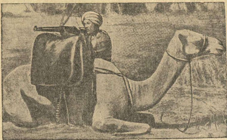
Верблюжий дозор суданских войск на эритрейской границе.

По сообщению корреспондента агентства Юнайтед пресс, в результате землетрясения в Мексике насчитывается много жертв. В городе Туспан убито 100 и ранено 85 человек. В городе Колима из-под развалин извлечено 36 трупов. Число убитых в других городах еще не установлено. (ТАСС).