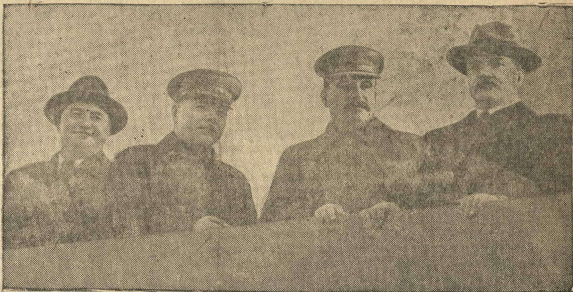
Справа налево: товарищи В. М. Молотов, И. В. Сталин, К. Е. Ворошилов и Г. М. Димитров на трибуне мавзолея.