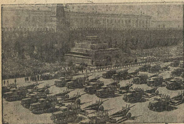
Парад войск на Красной площади. Артиллерия на параде.