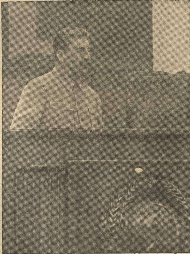
Выступление товарища И. В. Сталина на торжественном собрании, посвященном выпуску командиров, окончивших военные академии, состоявшемся в Большом Кремлевском дворце 5-го мая 1941 года.