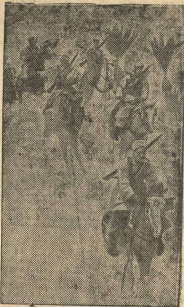
Туземная французская кавалерия генерала де Голля на фронте в Ливии.

Агентство Рейтер сообщает, что по заявлению австралийского военного министра Спендера, общие потери австралийских войск в Греции убитыми, ранеными и пропавшими без вести не превышают 3.000 человек. Всего в Греции находилось 16.000 австралийских солдат.