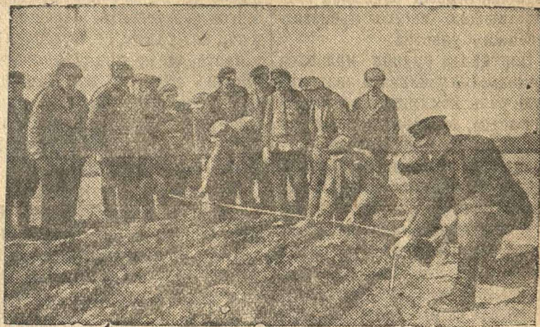
Весенние полевые работы в Советской Латвии. Здесь только что прошел советский трактор с пятилемешным плугом. Трудовые крестьяне впервые видят борозду такой ширины — почти 2 метра.