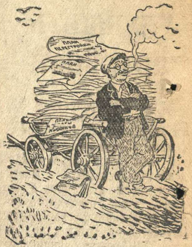
...а воз и ныне там!.. Рис. Баркова и Лисевича.

Руководители цеха № 3 Кулебацкого завода берут массу обязательств и составляют бесконечное количество планов, но практически еще не приступили к перестройке работы.