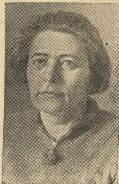
Анна Паукер—одна из активных деятелей рабочего движения в Румынии, долгое время находившаяся в заключении. В результате переговоров между правительствами СССР и Румынии тов. Паукер освобождена из тюрьмы. Она прибыла в СССР и находится в Москве.

Подробный отчет о полете субстратостата „СССР-ВР62“ будет опубликован в завтрашнем номере.