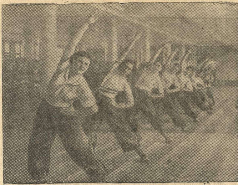
Группа девушек-комсомолок автозавода имени Сталина /Москва/ занимается гимнастикой.