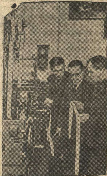
Рыбинский завод полиграфических машин сконструировал и изготовил скоростными методами первую в Союзе лентопечатную машину для «говорящей бумаги». На снимке: испытание новой машины.