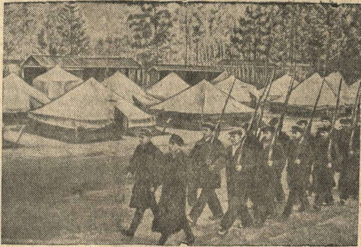
Осоавиахимовцы завода «Электросталь» (Московская область) на строевых занятиях.