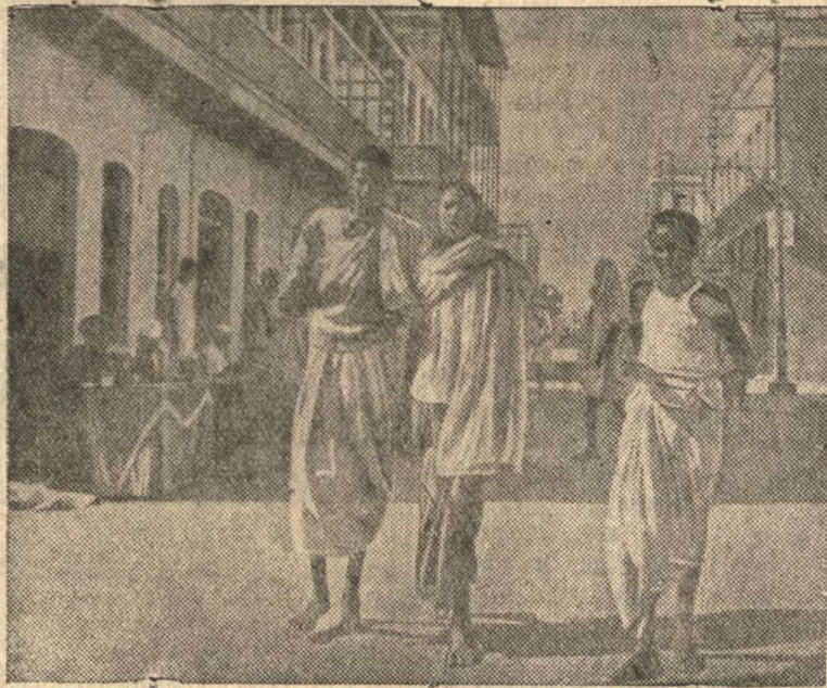
Улица в Джибути (Французское Сомали).

АДРЕСА И ТЕЛЕФОНЫ РЕДАКЦИИ: г. Кулебаки, Горьковской области, Красноармейская, 6. Телефоны: отв. редактора—40, зам. редактора (заводской)—1—34