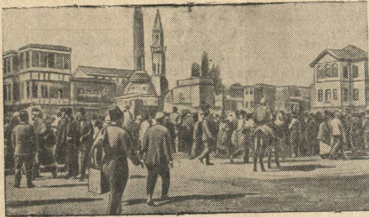
Площадь в Дамаске (столица Сирии).

АДРЕСА И ТЕЛЕФОНЫ РЕДАКЦИИ: г. Кулебаки, Горьковской области, Красноармейская, 6. Телефоны: отв. редактора—40, зам. редактора (заводской)—1—34, общий редакция—1-08, конторы типографии, корректорской и ночной редакции—42.