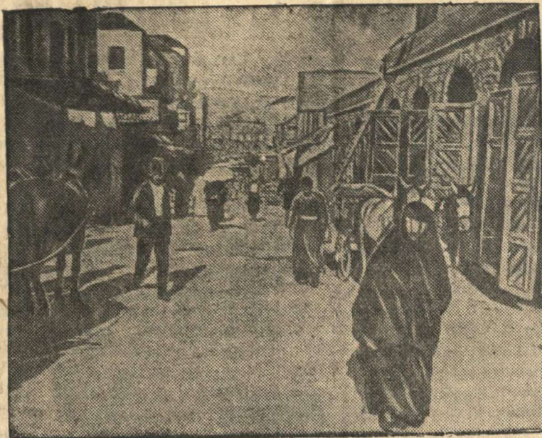
Улица в Бейруте (Сирия)