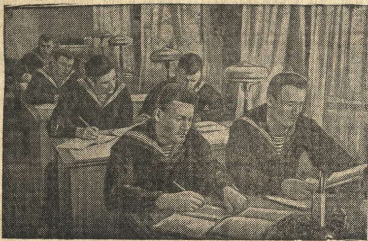
В парткабинете Пинской флотилии (БССР) краснофлотцы комсомольцы за изучением «Краткого курса истории ВКП(б)».