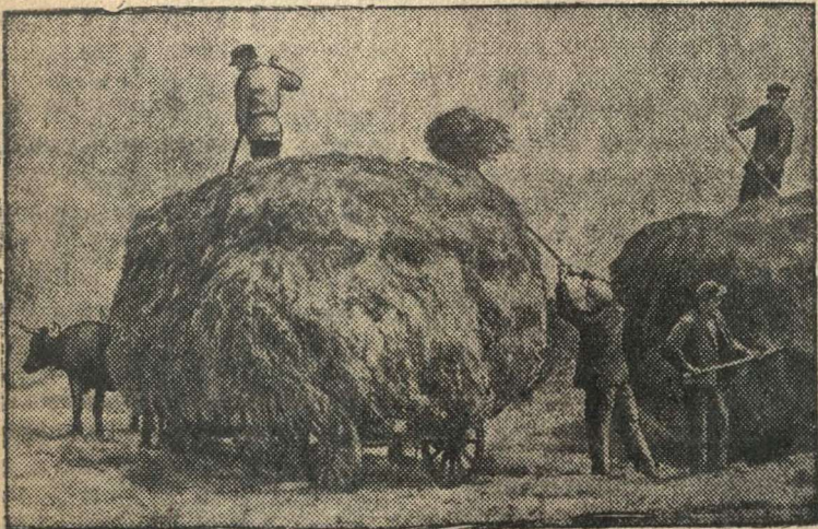
Уборка сена в орденноносном колхозе имени Первого мая (Целинский район, Ростовская область).