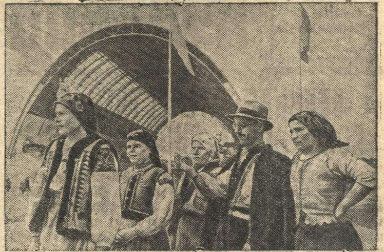
Всесоюзная сельскохозяйственная выставка 1941 г. На снимке: колхозники западных областей УССР у павильона механизации.