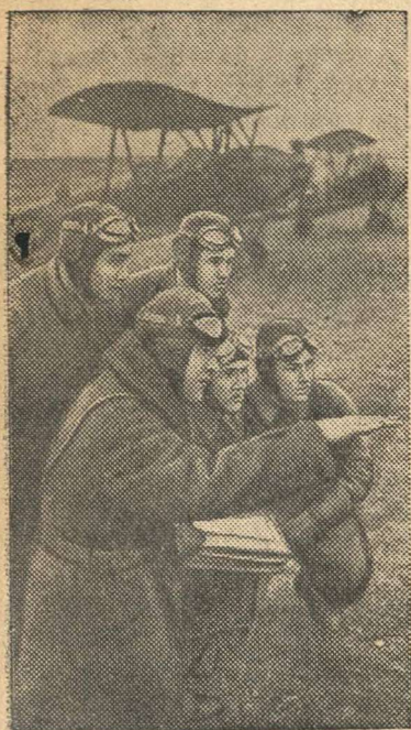
Аэроклубы столицы готовят пилотов. На снимке: разбор правильности взлета.