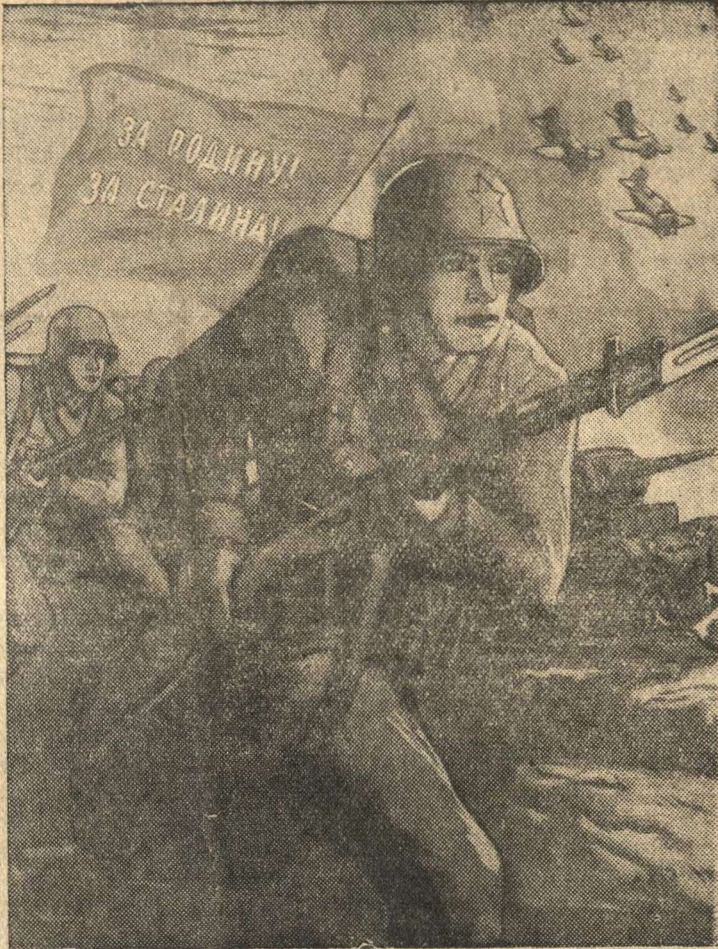
Будь горд, будь рад стать красноармейцем в ряд!