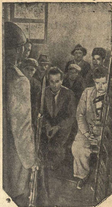
Захваченные немецкими фашистами сербские партизаны в ожидании расправы.

В эту же ночь небольшое количество самолетов противника сбросило бомбы на западе и юго-западе Англии, а также в Южном Уэльсе. Нанесен некоторый ущерб, имеются жертвы. (ТАСС).