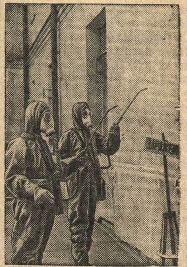
Комсомольская санитарная команда МПВО Юридического института Прокуратуры Союза (Москва). На снимке: очередное занятие дегазационного отделения.

Братьев на фронт провожая, Их замени на фронтах урожая