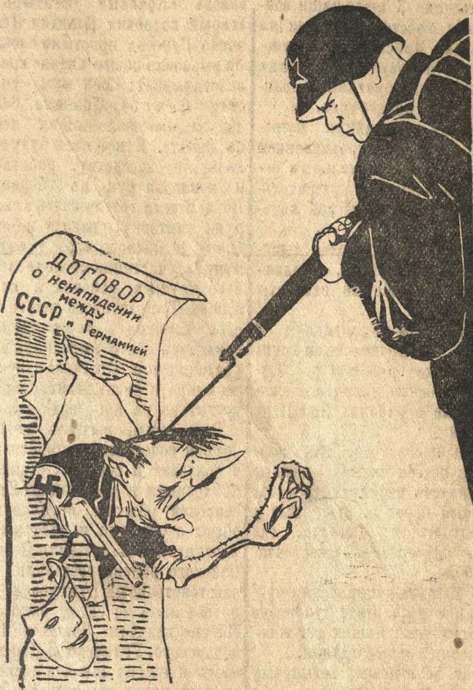
Беспощадно разгромим и уничтожим врага!

Вперед, за нашу победу! /Из передовой „Правды“ за 4 июля 1941 г./