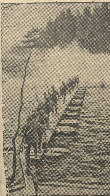
В Красной Армии. Форсирование водной преграды.

Корреспондент агентства Ассошиэтед пресс Маккензи также отмечает явное усиление русского сопротивления. Корреспондент заявляет, что «ожесточенное сопротивление Красной Армии, очевидно, опрокинуло германские планы быстрого продвижения».