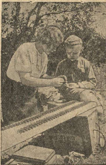
Боевые подруги командиров Н-ской части овладевают пулеметным делом. На снимке: за подготовкой пулеметной ленты.