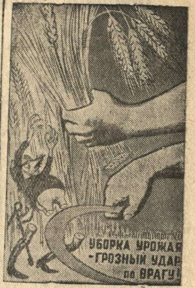
Рисунок худ. Кукрыниксы. (Репродукция с плаката, выпущенного издательством «Искусство».)