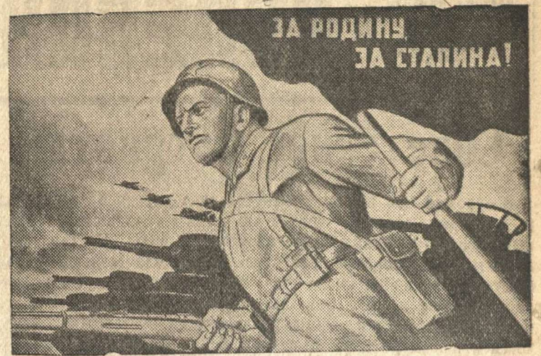
Рисунок лауреата Сталинской премии И. Тондзе. (Репродукция с плаката, выпускаемого издательством «Искусство»).

ских потерь можно полагать, что весь протекторат Чехии и Моравии специально предназначен для размещения раненых.