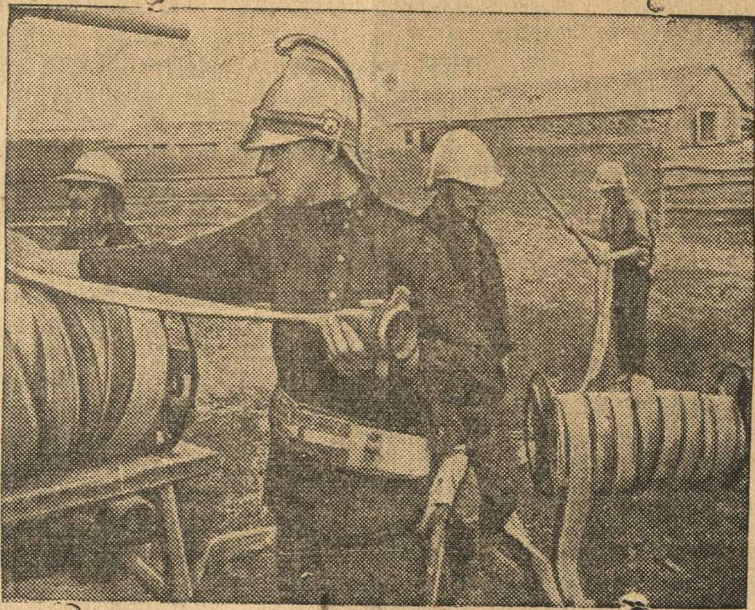
В колхозе «Новая жизнь» (Красно-Полянский район, Московская область), организованы пожарное звено, санитарные команды, кружки ПВХО, звенья охраны урожая и колхозной собственности. На снимке: пожарное звено на учебе.