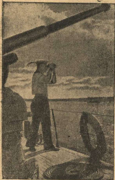
Моряки пограничники на боевой вахте.