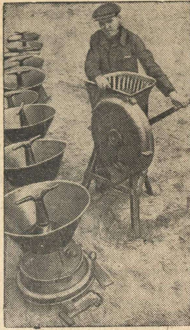
Корнерезки и кукурузодробилки, выпускаемые для колхозов днепрпетровской артелью «Красный литейщик».

Я слышу, как сейчас смеются киевляне, ленинградцы и харьковчане. И можно было бы ответить только смехом гитлеровским лжецам. Но нас интересует, почему именно в этот день, а не раньше и не позднее фашисты так безгранично заврались? Ответить на это не трудно. Вероломно напав на Советский Союз, Гитлер обещал народу Германии в течение десяти дней захватить всю Украину. Но прошло больше месяца и что же? На плодородных землях Украины нашли себе могилы лучшие фашистские армии. Все новые и новые ди-