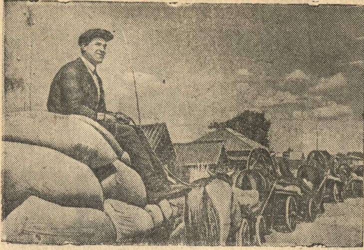
Железя всеми силами помочь фронту, колхозники Сухоложья (Свердловская обл.) досрочно выполняют свои обязательства перед государством. Ежедневно на пункты элеваторно прибывают красные обозы с хлебом. На снимке: красный обоз колхоза «Красный Урал». За один день колхоз сдал 104 центнера высококачественного зерна.