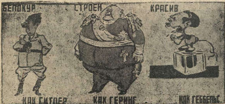
Рисунок Б. Ефимова (Окно ТАСС № 22).

Согласно фашистской расовой теории истинный ариец должен быть: