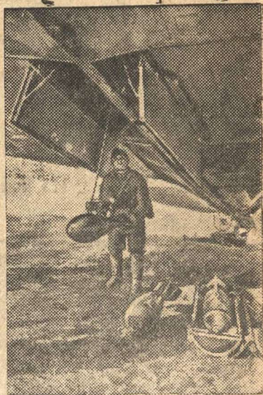
Перед боевым вылетом.