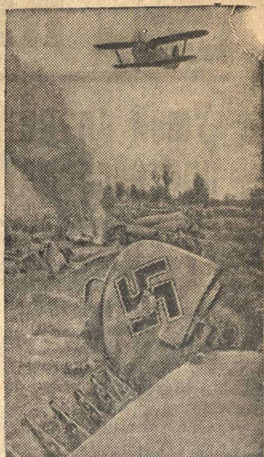
Славный советский сокол парит над сбитым им фашистским стервятником.