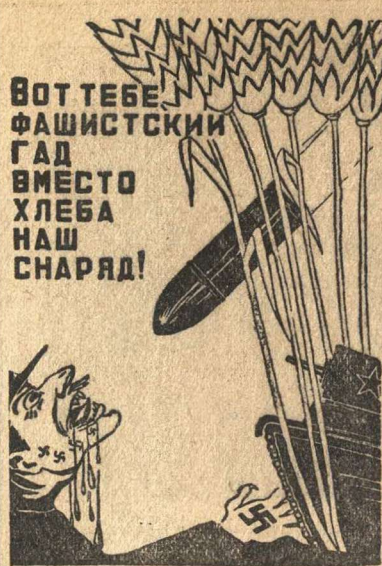
Плакат работы художника М. Китизарьяна

Местная контора «Торгподоовощ» организовала в сельской местности района 4 заготовительных пункта. Были проведены семинары, на которых руководители этих пунктов прослушали беседу «Как правильно организовать сбор и