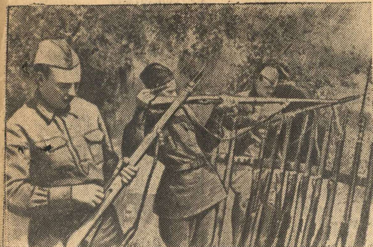
В лагерях подразделений народного ополчения Ленинского района г. Москвы. Ополченцы получили боевое оружие.