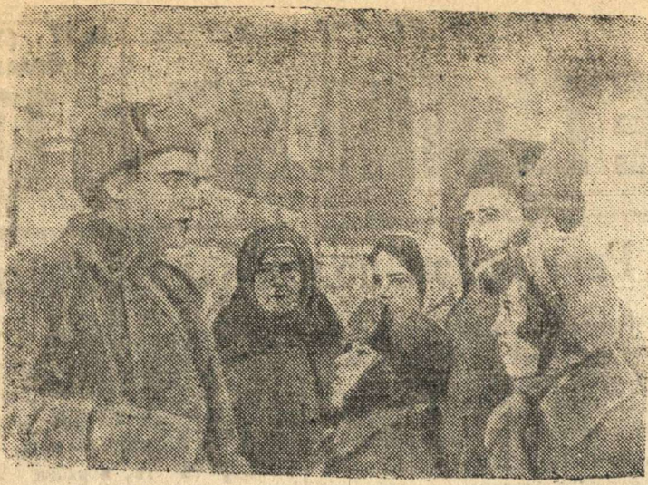
Жители поселка Косня Гора беседуют с бойцом тов. Головки