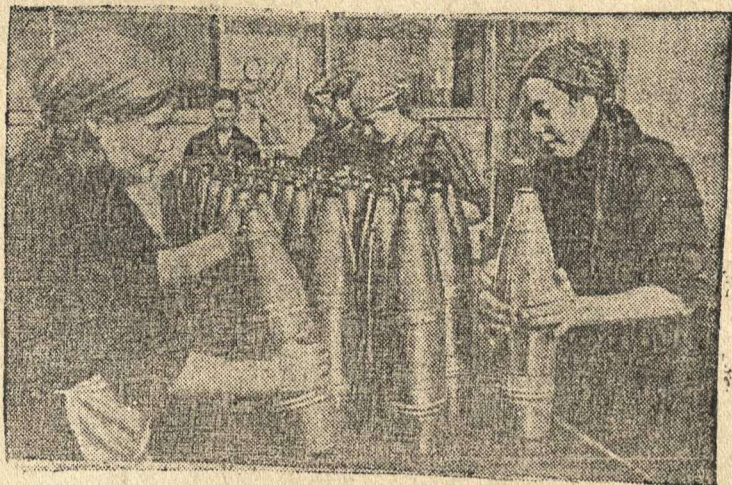
Коллектив Н-ского завода в одном из городов Поволжья во время войны быстро перестроил свою работу и начал выпускать разное вооружение для Красной Армии. На снимке: бригада упаковщиц смазывает снаряды.