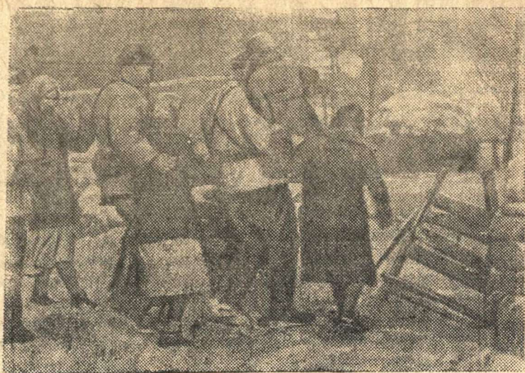
Партизаны в разлуке в родное село С. после освобождения его от немцев. Радостно их встретили родные и близкие.