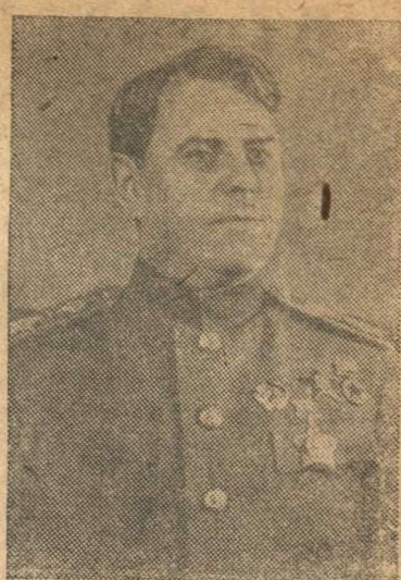
Маршал Советского Союза А. М. ВАСИЛЕВСКИЙ.