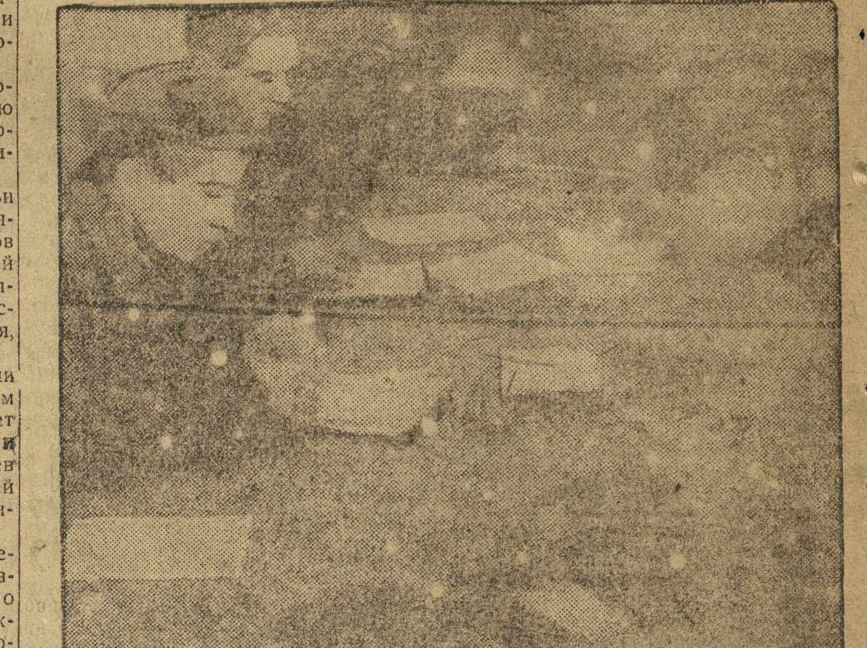
При мартовском цехе работают курсы по повышению технической грамотности машинистов и помашинистов

Наша организация за это время проделала большую работу. Мы добились успехов в области индустриализации края. Наша краевая партийная организация мобилизовала классовую бдительность и революционную активность рабочего класса против классового врага, против бюрократов и оппортунистов, являющихся агентурой нашего классового врага, развернула самокритику, отмежевавшись от чуждой враждебной нам самокритики, от самокритики троцкистской и правобуковинской.