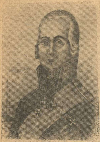
Ф. Ф. УШАКОВ.