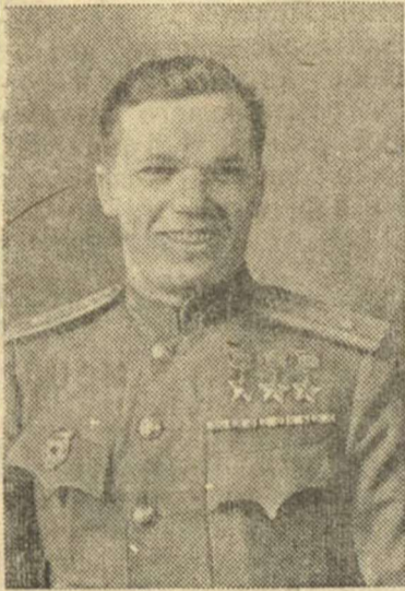
Гвардии майор Иван Никитович Кожедуб.