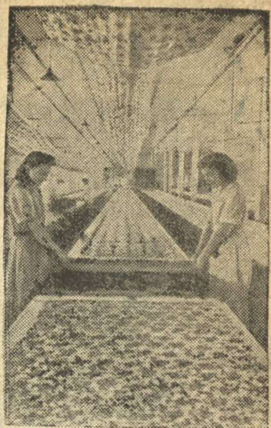
На Каунасской текстильной фабрике (Литва) отлично освоена набивка шелковых и хлопчатобумажных тканей. На снимке: в набивном отделении фабрики.