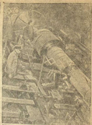
На Ленинградском ордена Ленина металлическом заводе имени Сталина. Обработка ротора мощной турбины.