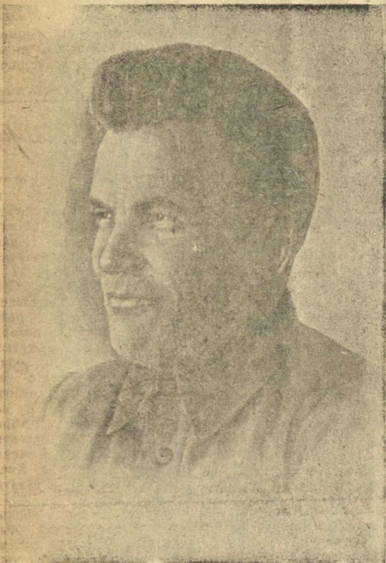
С. М. КИРОВ.