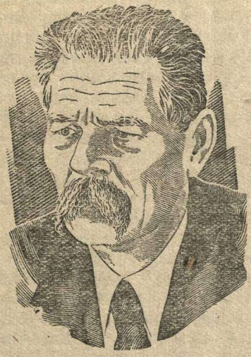
Алексей Максимович Горький

Живут и вечно будут жить творения великого пролетарского писателя. Они зовут трудящихся всего мира к борьбе с капитализмом, против империалистической войны, к борьбе за свободу и счастье всего человечества.