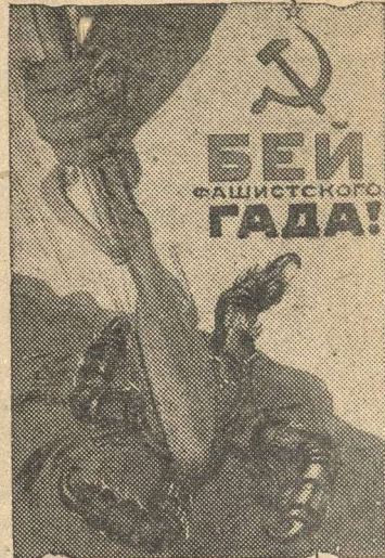
Рисунок художника Кокорекина (Репродукция с плаката, выпущенного издательством «Искусство»).

Подготовить сотни тысяч новых бойцов для защиты родины, сделать советский тыл неуязвимым для коварного врага — вот чему отдает сейчас все свои силы советская молодежь. В Туле много молодых трудящихся вступили в истребительные отряды по борьбе