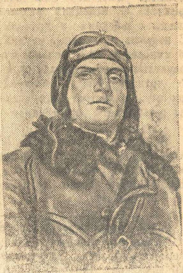
Герой Советского Союза батальонный комиссар Г. А. Тараник.