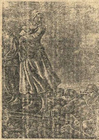
Выставка «Великая Отечественная война» в Государственной Третьяковской галерее. На снимке: «Варварство немецких оккупантов» — картина работы художника И. Голдье

◆ Ниже публикуется акт о чудовищных зверствах немецко-фашистских мерзавцев в селе Вторая Бугаевка, Воронежской области. «Немцы издевались и глумились над жителями села. Они заставляли нас работать, не разгибая спины, на ремонте и расчистке дорог. В конце лета вблизи села был найден труп убитого немецкого офицера. Гитлеровские бандиты схватили первых попавшихся на глаза 20 мирных жителей и заперли их в амбар. Древоубийцы долго мучили и пытали. Палачи расстреляли 16 человек, а остальных 4-х колхозников повесили в присутствии всего населения. При отступлении немцы сожгли 35 домов, здание сельсовета, 2 школы, избы-читальню, конный двор колхоза и другие постройки. Фашистские изверги бросали гранаты в погреба и щели, где ютились женщины с детьми». Акт подписали колхозницы Гахова, Бугаева и др.