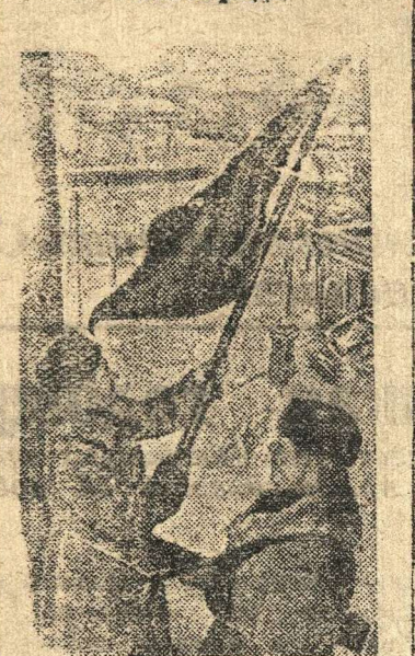
На снимке: Красное Знамя вновь развевается над Шлиссельбургом.