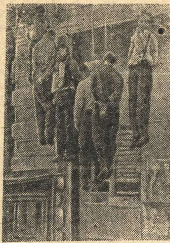
На снимке: Мирные жители, повешенные гитлеровцами