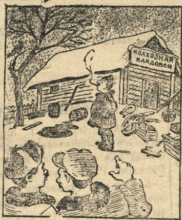
— Удивляюсь, как правление колхоза терпит такого «хозяйственника».