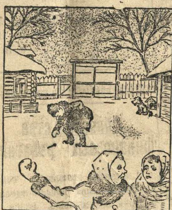
— Мой то хозяйственный какой: каждый гвоздик у себя на дворе подберет.