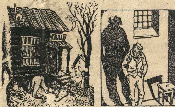
Почти по Грибоедову