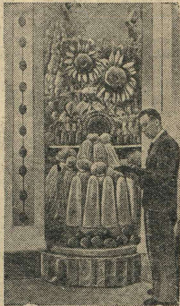
Станд технических культур в ввводном зале Навильона «Сибирь».

На Всесоюзной сельскохозяйственной выставке.