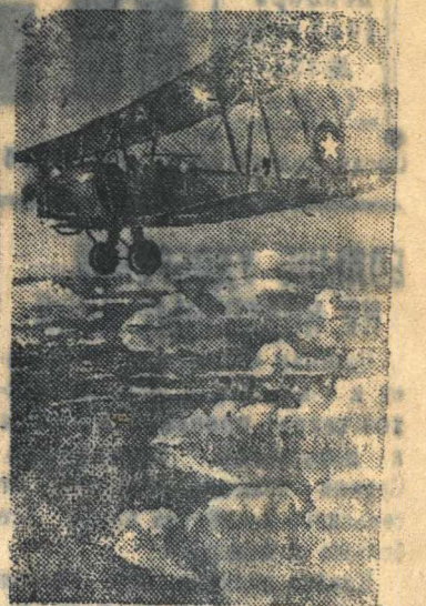
На снимке: Связной самолет Н-ской авиачасти, скрывался за облаками, летит на выполнение задания в тыл врага.