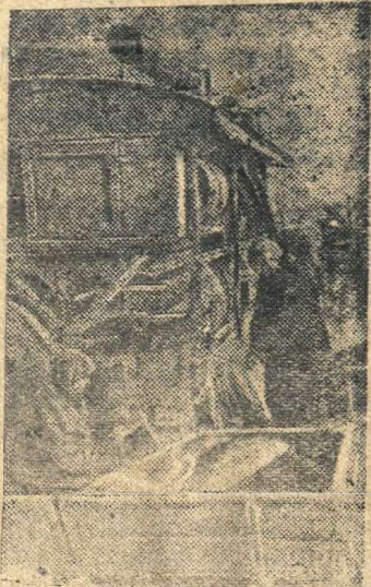
Очистка семенного материала к весеннему сезону в колхозе имени Чкалова (Буранный район, Чкаловская область).

Колхозники и колхозницы, организуем соревнование в честь XXV годовщины Красной Армии! Еще напряжем свои силы во имя победы над проклятым фашизмом.