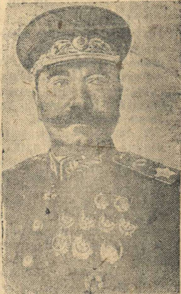
Маршал Советского Союза